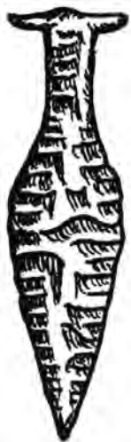
Pugnale in selce di Hindgavl, 2000 a.C.

Ertebölle), che si estende dalla Scandinavia alle coste del Baltico. Fusione dei ghiacci dell'Inlandis e formazione del Belt (Fionie/Sjælland e stretto dell'Oresund).